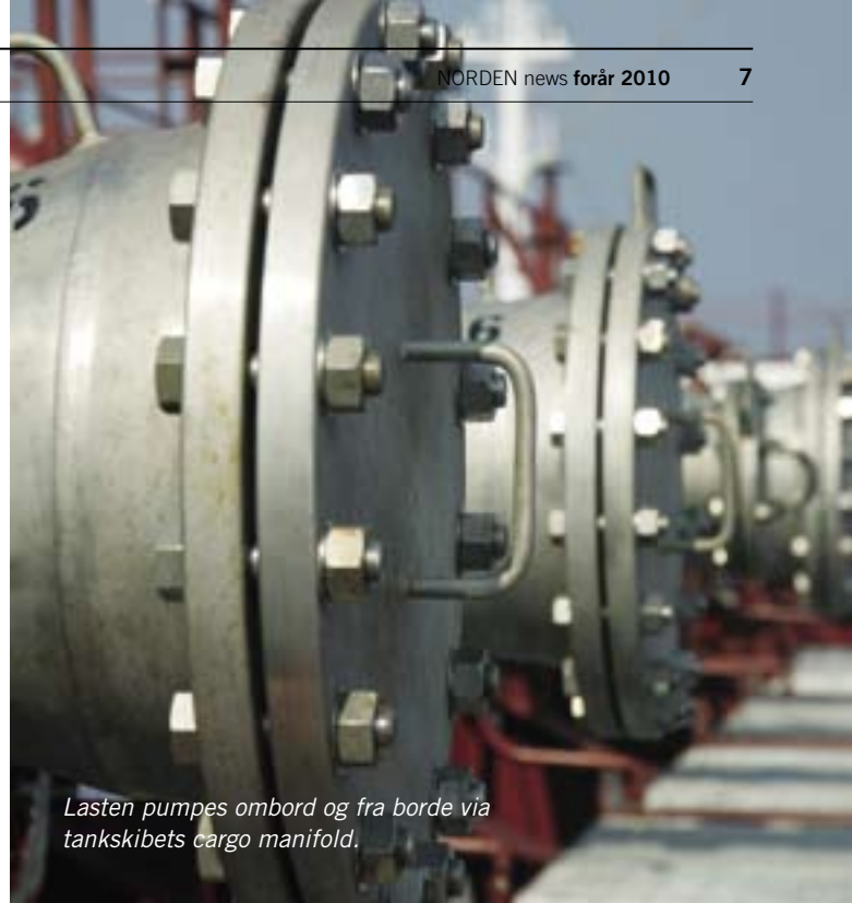
Lasten pumpes ombord og fra borde via tankskibets cargo manifold.

Tankskibe med isklasse skal blandt andet have forstærket skrog og øget motorkraft, og mandskabet skal have særlige kundskaber i sejlads og procedurer under ekstreme vejrforhold. NPP er en af de førende inden for isklassede skibe og viden om, hvordan man sejler i is. Blandt andet bliver kaptajnerne på Interiorients skibe sendt på rederiets eget issimulatoretræningscenter i Riga i Estland for at træne i at sejle i is.